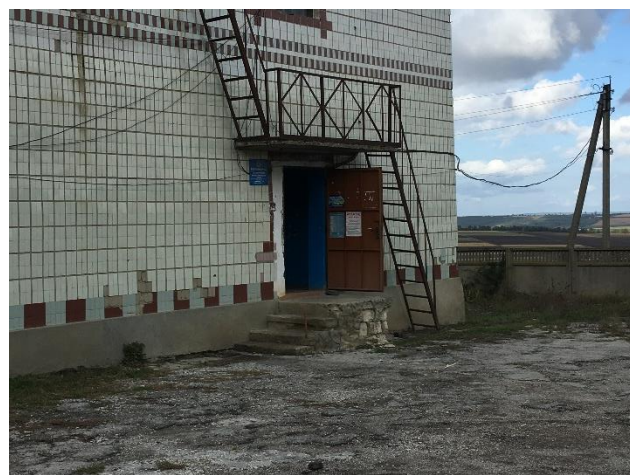
Clădirea Primăriei și oficiului poștal, nu dispun de bare de suport, rampe de acces